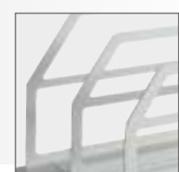
Stojak do schładzania dokumentacji