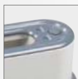
Dioda wskazująca gotowość urządzenia do pracy