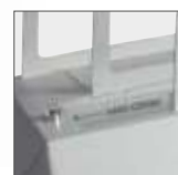
Okladki miękkie dosuń do prawej, a twarde do lewej krawędzi szczeliny bindującej

Profesjonalna termobindownica dwusystemowa. Posiada system rozpoznawania i automatycznego doboru parametrów oprawy dla okładek miękkich i twardych (O.DIPLOMAT). Wyposażona w fotokomórkę i energooszczędną grzałkę.