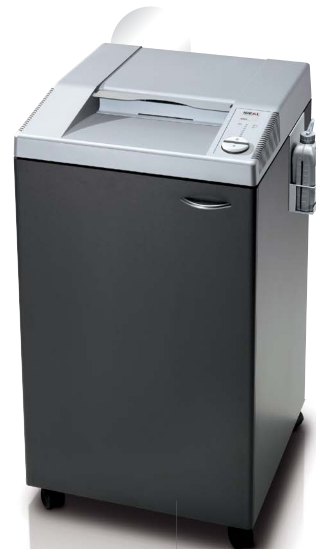
EBA 0201 OMD

Urządzenie na specjalne zamówienie. O cenę pytaj sprzedawcę.