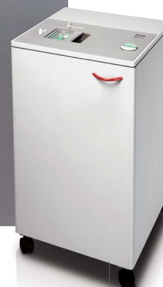
EBA 0101 HDP

EBA wychodzi naprzeciw nowym oczekiwaniom klientów. Oprócz klasycznych modeli przybiurkowych niszczarek do papieru oferuje urządzenia specjalistyczne - NISZCZARKI DO PŁYT CD/DVD I DYSKÓW KOMPUTEROWYCH.