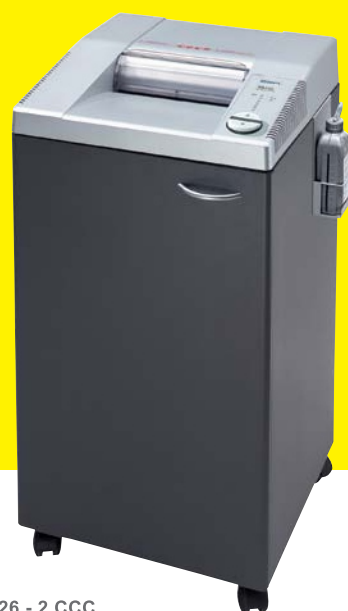
EBA 2026 - 2 CCC